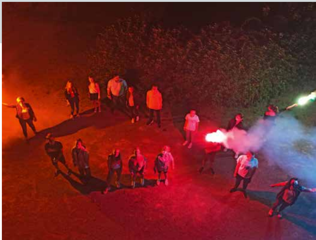
Grüße aus dem CVJM Nümbrecht