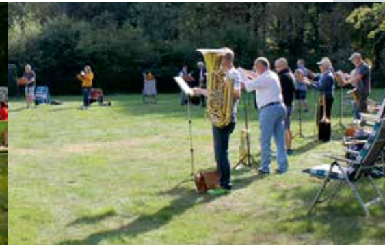
Jahresfest in Wilgersdorf