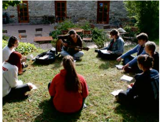
Die Einführungsseminare für den neuen Jahrgang »Freiwilligendienste in Deutschland 2020/2021« konnten im Sommer als Präsenzveranstaltungen stattfinden

Was macht die Arbeit des CVJM eigentlich aus? Wieso sind die Angebote so beliebt? Was treibt den CVJM an? Wenn ich über diese Fragen nachdenke, dann komme ich in allen Punkten auf einen gemeinsamen Nenner: Im CVJM wird Kinder- und Jugendarbeit von jungen Menschen für junge Menschen gestaltet.