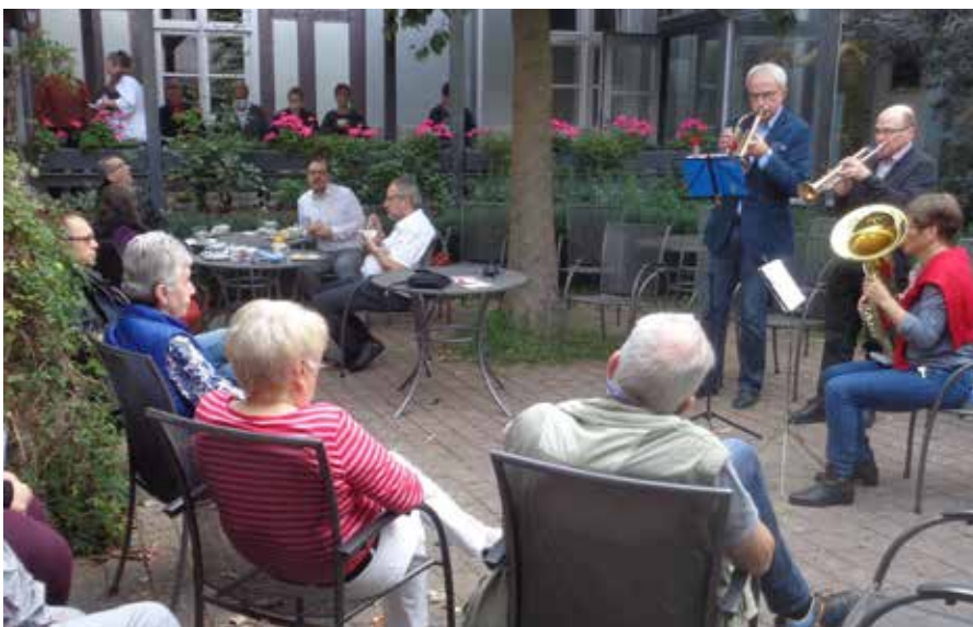
Die Bläser des Freundeskreises

Zu lebhaften Debatten führte ein Vortrag, den der Kirchenjurist Gebhard Dawin auf der Grundlage von Presseberichten zum Thema »Die Kirche in der Corona-Pandemie« hielt. Die anschließende Diskussion beschäftigte sich mit der Frage, warum zum Beispiel in der Nordkirche die Kirchenleitung nahezu sprachlos agierte und agiert, während sich manche örtlichen Gemeinden einiges einfallen ließen und lassen, um als Kirche nicht