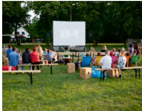
Open-Air-Kino in Bad Belzig

Aber die Unsicherheit, wie sich die Pandemie weiterentwickelt, macht den Mitarbeitenden in Wilgersdorf